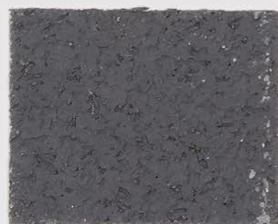
CASTELLO BEIGE + DT #101 - 4 cc + DT #111 - 1 cc; VELATURA VINTAGE MATT