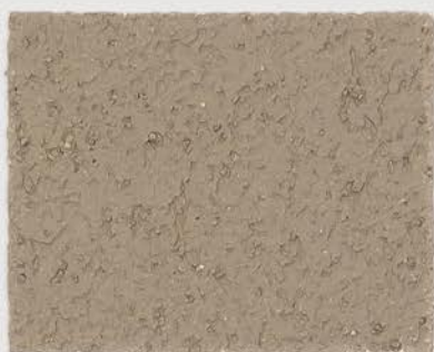
CASTELLO BEIGE + DT #124 - 4 cc; VELATURA VINTAGE MATT