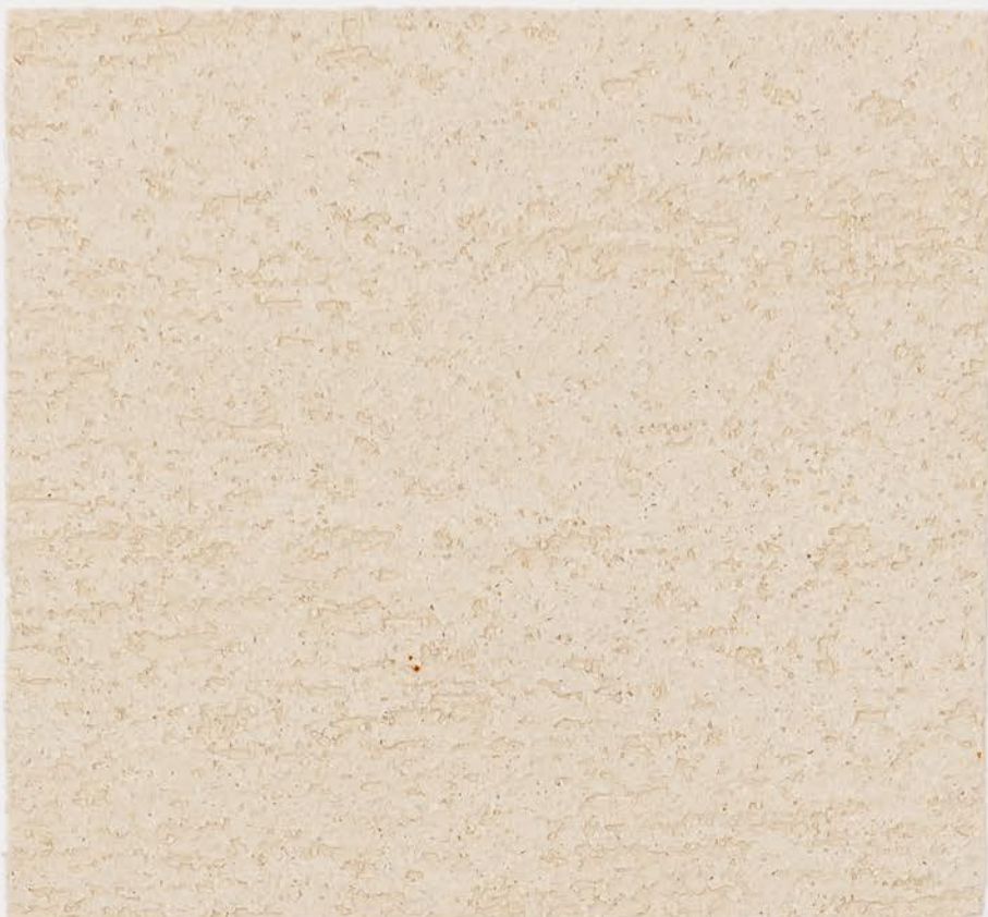
CASTELLO BEIGE + TT №503 - 0,5 cc; VELATURA VINTAGE MATT