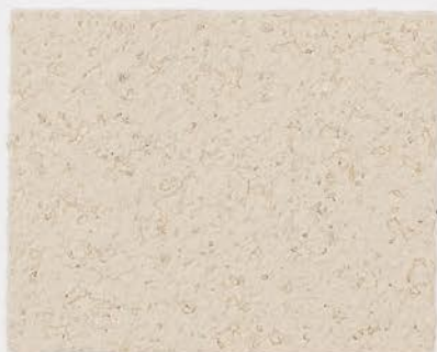
CASTELLO BEIGE + TT №502 - 0,5 cc; VELATURA VINTAGE MATT