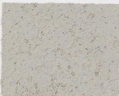
CASTELLO BEIGE + DT #104 - 1 cc + DT #109 - 0,5 cc; VELATURA VINTAGE MATT