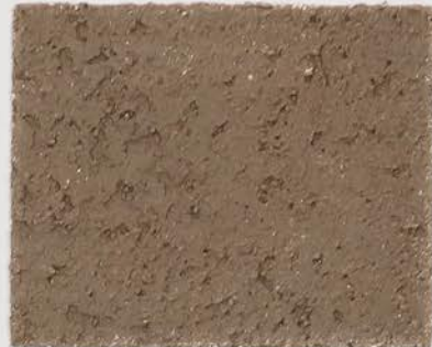
CASTELLO BEIGE + DT #122 - 4 cc + DT #124 - 6 cc; VELATURA VINTAGE MATT