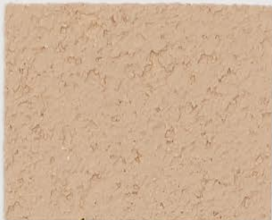
CASTELLO BEIGE + DT #120 - 1 cc + DT #124 - 1 cc; VELATURA VINTAGE MATT