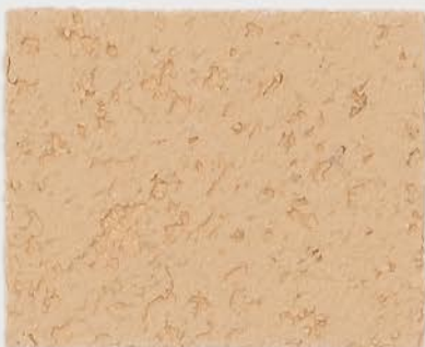
CASTELLO BEIGE + DT #103 - 3 cc; VELATURA VINTAGE MATT