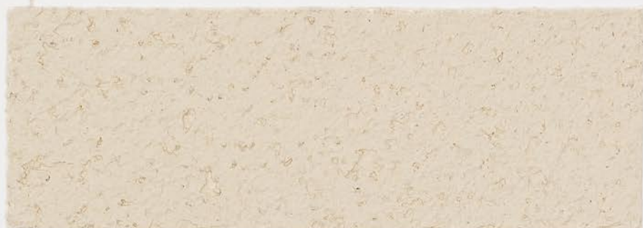
CASTELLO BEIGE + DT №124 - 0,5 cc; VELATURA VINTAGE MATT