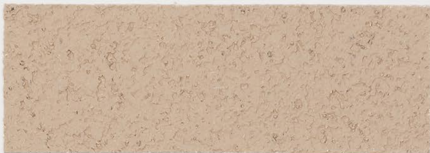
CASTELLO BEIGE + DT #123 - 2 cc; VELATURA VINTAGE MATT