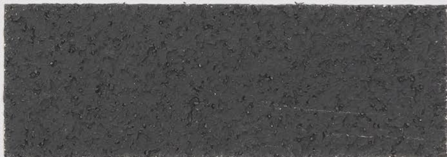
CASTELLO BEIGE + DT #101 - 6 cc + DT #103 - 0,5 cc; VELATURA VINTAGE MATT