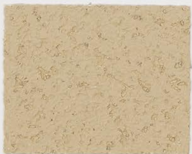
CASTELLO BEIGE + DT #102 - 2 cc VELATURA VINTAGE MATT