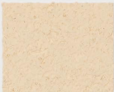
CASTELLO BEIGE + DT #121 - 0,5 cc; VELATURA VINTAGE MATT