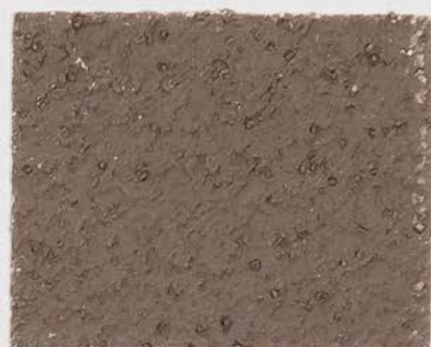
CASTELLO BEIGE + DT #120 - 4 cc + TT #501 - 4 cc; VELATURA VINTAGE MATT