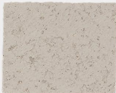
CASTELLO BEIGE + TT №501 - 1 cc; VELATURA VINTAGE MATT