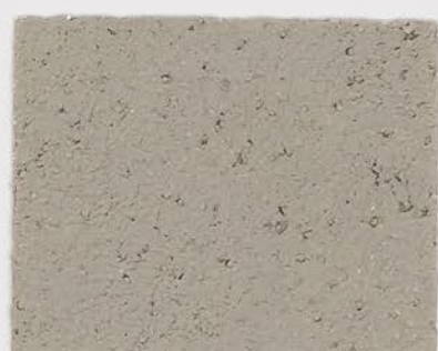
CASTELLO BEIGE + DT #101 - 1 cc + DT #115 - 0,5 cc; VELATURA VINTAGE MATT