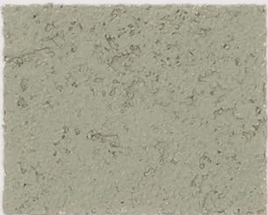
CASTELLO BEIGE + DT #124 - 2 cc + TT #504 - 0,5 cc; VELATURA VINTAGE MATT