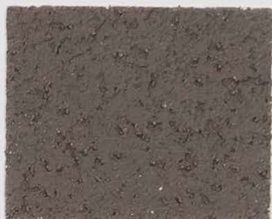
CASTELLO BEIGE + TT #501 - 4 cc + TT #503 - 4 cc; VELATURA VINTAGE MATT