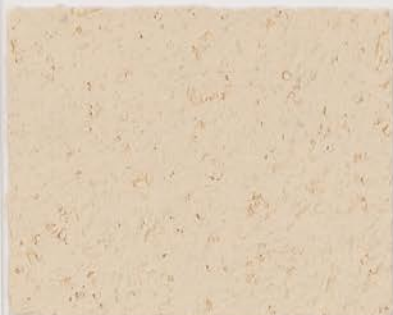
CASTELLO BEIGE + DT #122 - 0,5 cc; VELATURA VINTAGE MATT