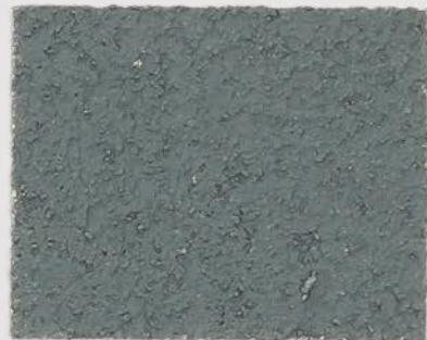
CASTELLO BEIGE + DT #124 - 3 cc + TT #505 - 2 cc; VELATURA VINTAGE MATT