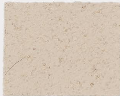
CASTELLO BEIGE + TT №502 - 0,5 cc + TT №503 - 0,5 cc; VELATURA VINTAGE MATT