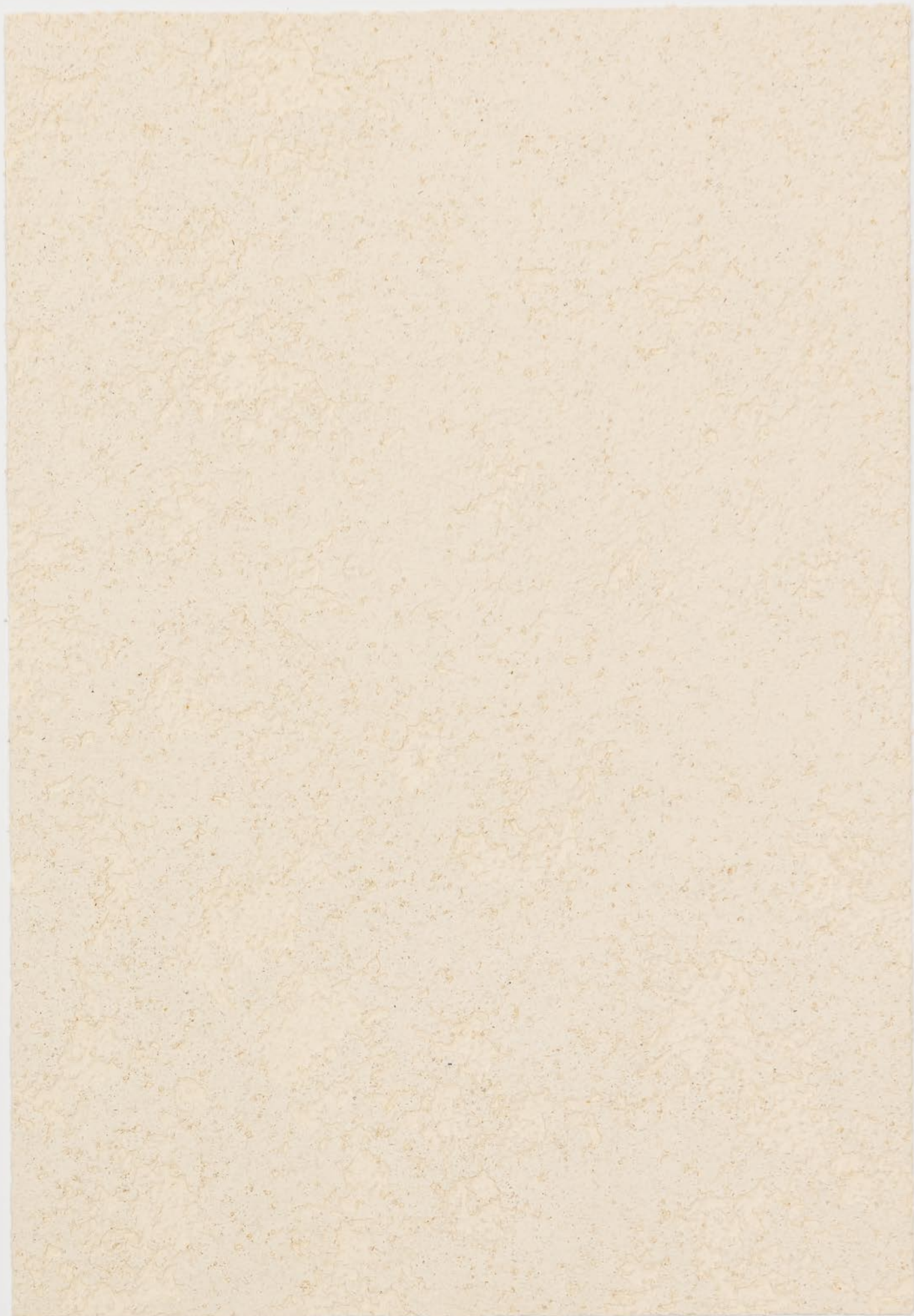
CASTELLO BEIGE; VELATURA VINTAGE MATT